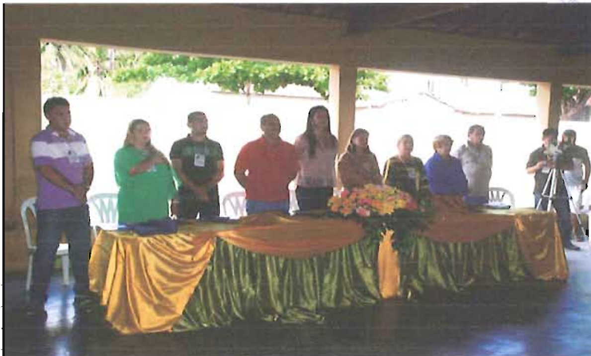
COORDENADOR DA CONFERENCIA E SECRETÁRIO DE INFRAESTRUTURA